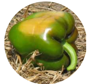
Pimiento dañado por el sol

Purshade reduce el estrés solar de los cultivos protegiendo el follaje y también protege el fruto del daño que causa la radiación ultravioleta (UV) e infrarroja (IR), además de permitir que se produzca la fotosíntesis. Se ha comprobado que Purshade, diseñado con tecnología de reflectancia de avanzada y basado en carbonato de calcio, un mineral altamente reflectante, reduce el daño por quemaduras de sol y minimiza el estrés general causado por el calor. Purshade refleja en forma eficaz la pernicioso radiación UV e IR, alejándola de las plantas.