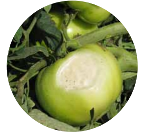
Tomate dañado por el sol

Ya sea que esté cultivando tomates o pimientos para su procesamiento o venta en el mercado de productos frescos, las condiciones de sol y calor extremo podrían disminuir sus rendimientos. Al comienzo de la temporada, estas condiciones extremas podrían afectar el arraigo de la planta y su estado general de salud y más tarde, cuando ya está madurando el fruto y es más sensible a las quemaduras del sol directo, las pérdidas podrían ser considerables. Los frutos dañados, al clasificarlos en la cosecha, reducen directamente la ganancia del agricultor.