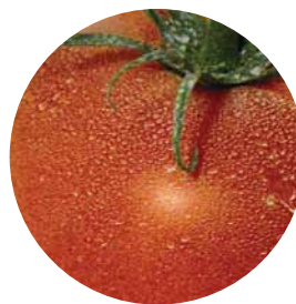
Muestra de cobertura ideal