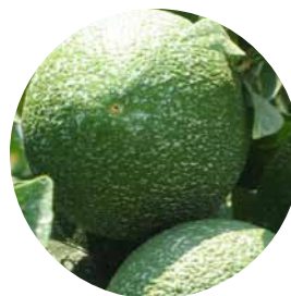
Muestra de cobertura ideal