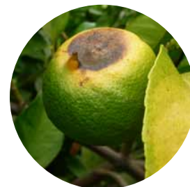
Limón con daños serios

Purshade reduce el estrés solar de los cultivos protegiendo el follaje y también protege el fruto del daño que causa la radiación ultravioleta (UV) e infrarroja (IR), además de permitir que se produzca la fotosíntesis. Se ha comprobado que Purshade, diseñado con tecnología de reflectancia de avanzada y basado en carbonato de calcio, un mineral altamente reflectante, reduce el daño por quemaduras de sol y minimiza el estrés general causado por el calor. Purshade refleja en forma eficaz la perniciosa radiación UV e IR, alejándola de las plantas.