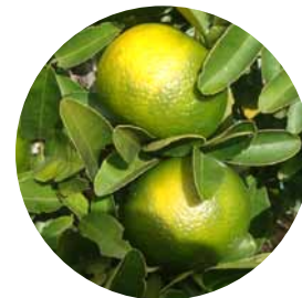
Mandarinas dañadas por el sol

Hay una gran variedad de cítricos que son sensibles al estrés solar y quemaduras de sol. Este estrés puede devastar un cultivo: reduciendo considerablemente la producción comercializable y recortando sensiblemente las ganancias del agricultor. En primer lugar, en el momento del arraigo, Purshade® puede proteger los árboles recién plantados de condiciones extremas y acelerar la productividad de las plantas jóvenes. En segundo lugar, cuando los árboles de cítricos jóvenes y arraigados sufren estrés solar extremo, interrumpen la actividad fotosintética, limitando la productividad general, lo que también podría ocasionar una pérdida considerable de frutos. Y en tercer lugar, los daños que las quemaduras de sol directas producen en los frutos disminuyen los rendimientos y reducen las ganancias en la cosecha.